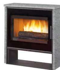
ARTY Pierre ollaire Acier noir