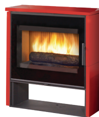
ARTY Céramique cerise Acier noir