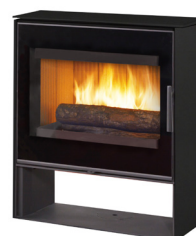
ARTY Acier noir