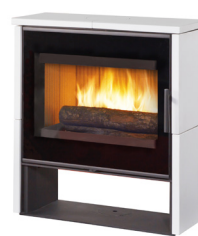
ARTY Céramique blanc mat Acier noir