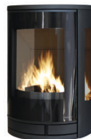
Acier noir cotés vitrés