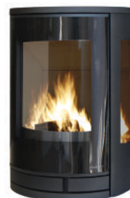
Acier noir cotés vitrés