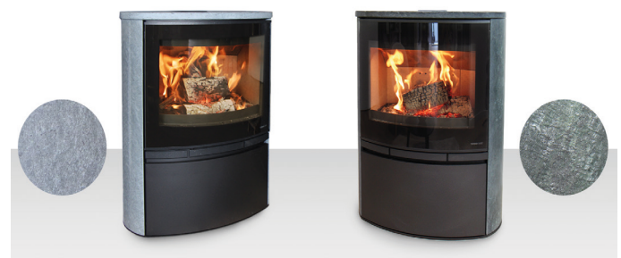
MABLY Pierre ollaire Acier noir