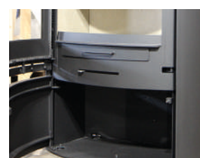
Large tiroir cendrier et compartiment technique avec porte fermeture aimantée.