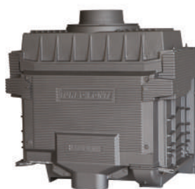
Vue arrière de l'échangeur