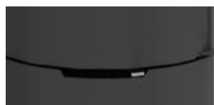
TIRETTE / SYSTÈME GLISS'AIR