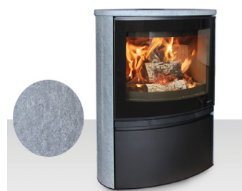
MABLY Pierre ollaire Acier noir