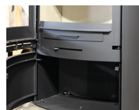
Large tiroir cendrier et compartiment technique avec porte fermeture aimantée.