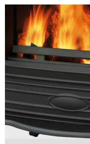
640 WD Fonte noire

Conduit de raccordement fumée disponible dans la même couleur que le poêle